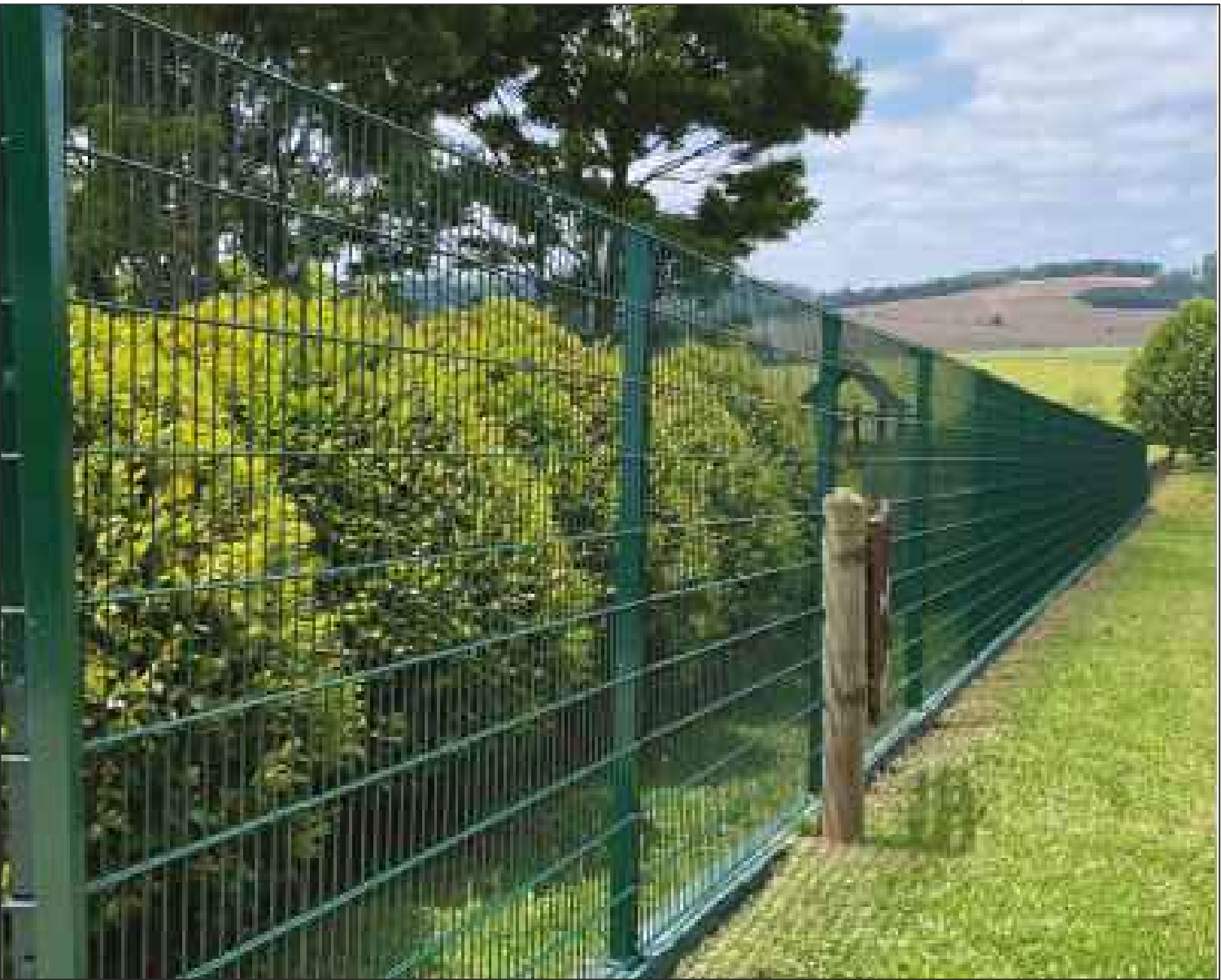
MODELO DE GRADIL

GRADIL METÁLICO REVESTIDO EM PVC/EMBORRACHADO EM MÓDULOS COM 2,03 M DE ALTURA E 2,50 M DE LARGURA EXTENSÃO TOTAL LOCAL 1: 165,00m com 1,53m de altura EXTENSÃO TOTAL LOCAL 2: 88,80m com 2,03 de altura