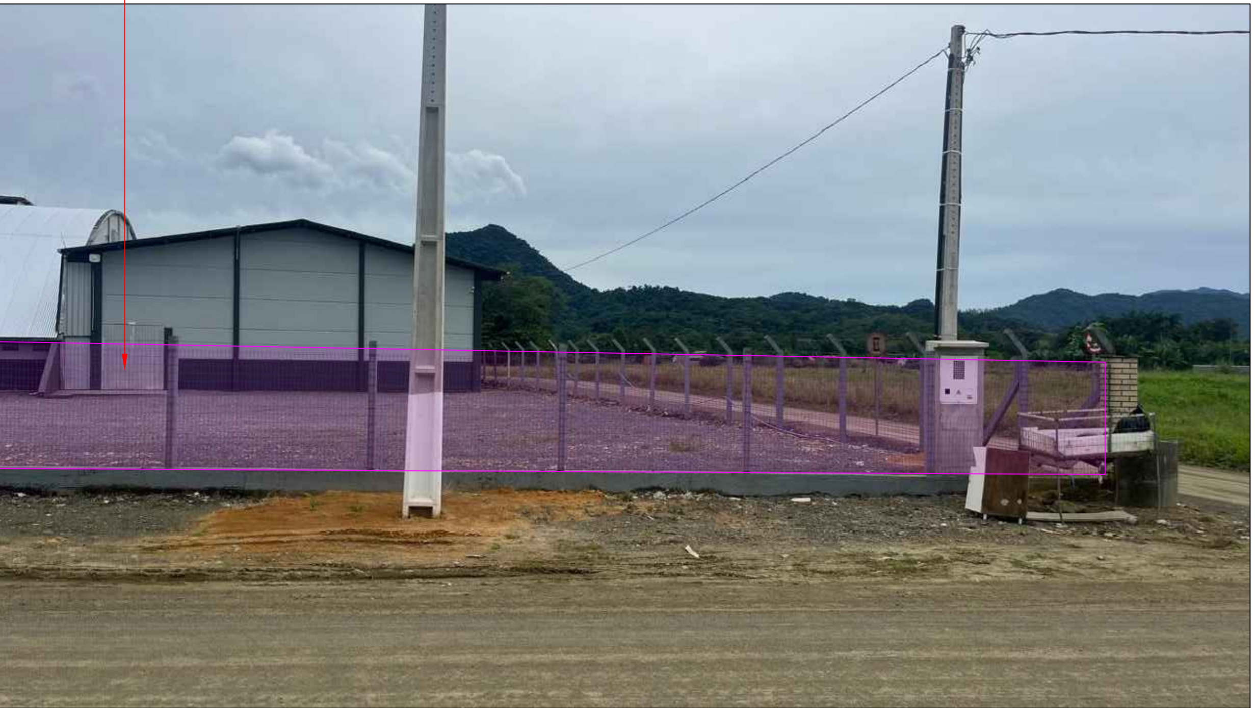
IMAGEM EM PERSPECTIVA SEM ESCALA