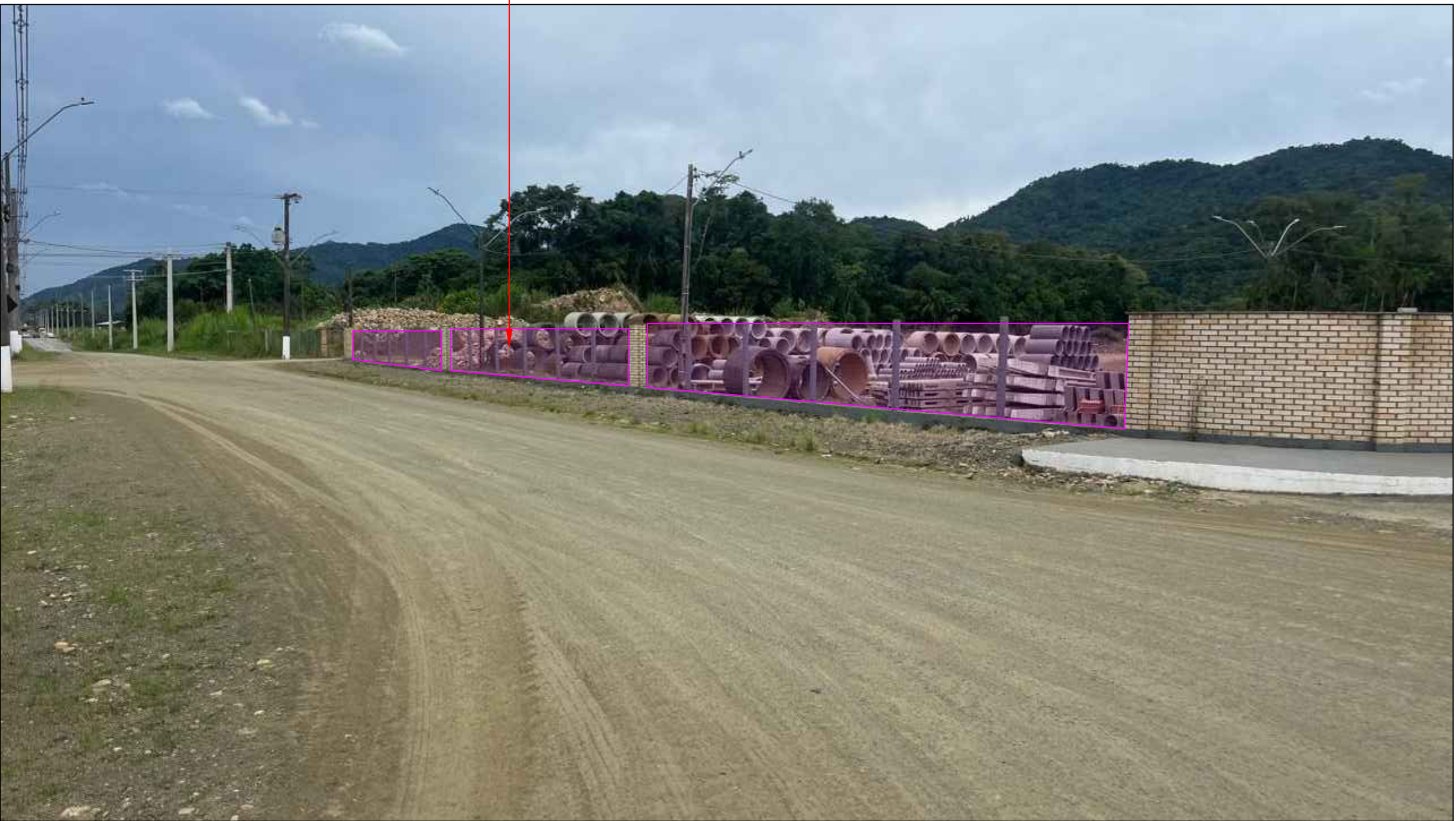
IMAGEM EM PERSPECTIVA SEM ESCALA