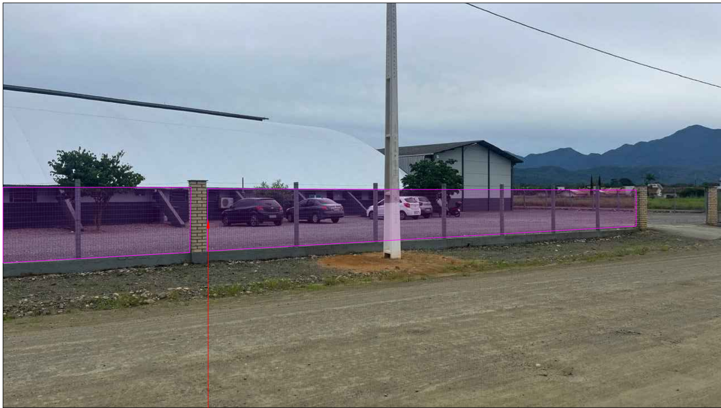
IMAGEM EM PERSPECTIVA SEM ESCALA