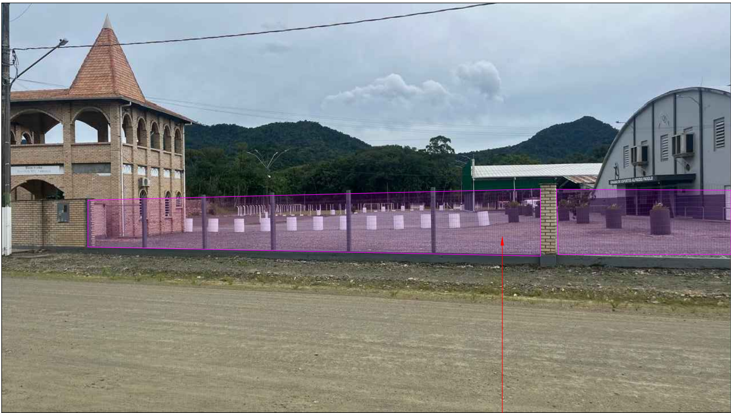
IMAGEM EM PERSPECTIVA SEM ESCALA